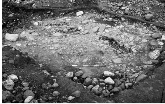
FIG. 4. Forni di Sopra. La necropoli altomedievale presso Andrazza in una foto generale dell'area di scavo.

È pressoché accertata, dunque, la presenza di un insediamento in età altomedievale, forse non lontano o in totale corrispondenza rispetto all'attuale abitato di Andrazza. Il livello riferito all'uso cimiteriale si trova a una quota di circa 30-40 cm dall'attuale piano di calpestio;