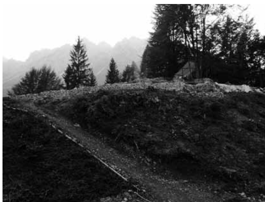
FIG. 2. Cuol di Ciastiel. Il paramento orientale del muro di cinta.