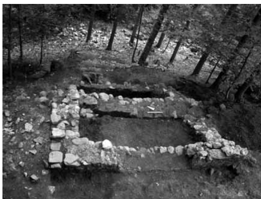
FIG. 3. Cuol di Ciastiel. Due delle tre torri che intervallano il muro di cinta finora messo in luce.